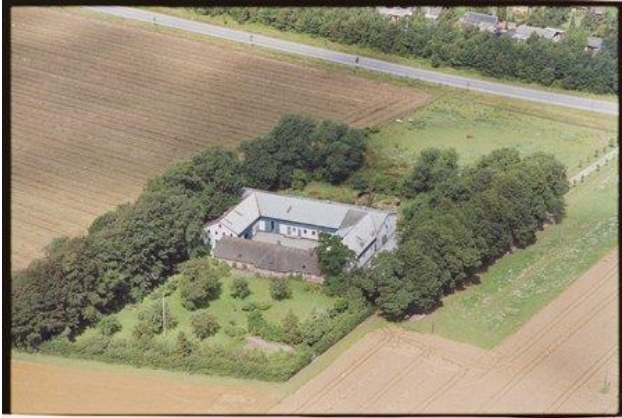
Vejgård ca. 1989.