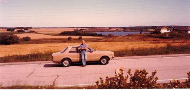
Den beige Taunus.