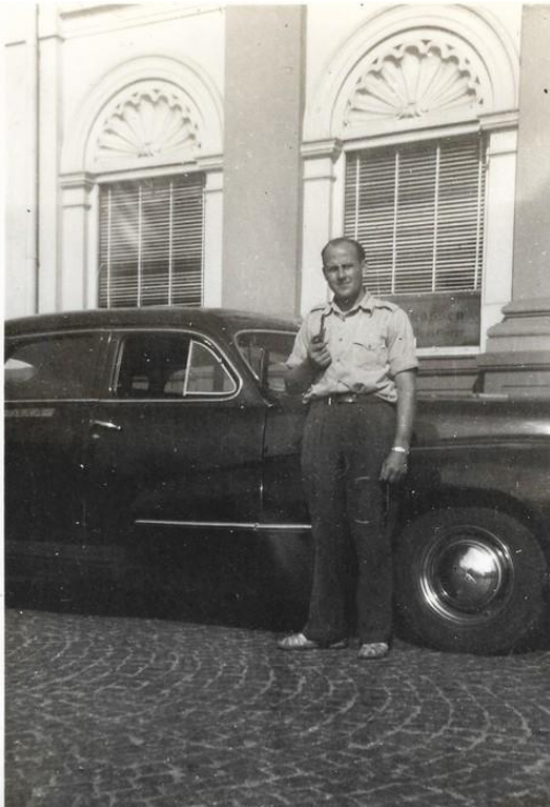
På Stændertorvet med sin Customline.