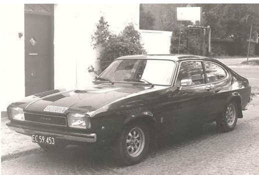
Den brune Capri.

at de kurser og efteruddannelser der var nødvendige ikke var forenelige med hans alder. I perioder kørte han kul, koks og olie/benzin for Tempo-tanken i Roskilde. Den lå på hjørnet af Holbækvej og Sønderlundsvej. I en ganske kort periode var han ansat som vognmand og kørte blandt andet vare for Netto. Fra ca. 1985 til sin død i 1991 var han pedel på pensionatet i Svogerslev på Marievej.