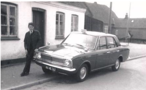
Den røde Cortina i Bygaden.