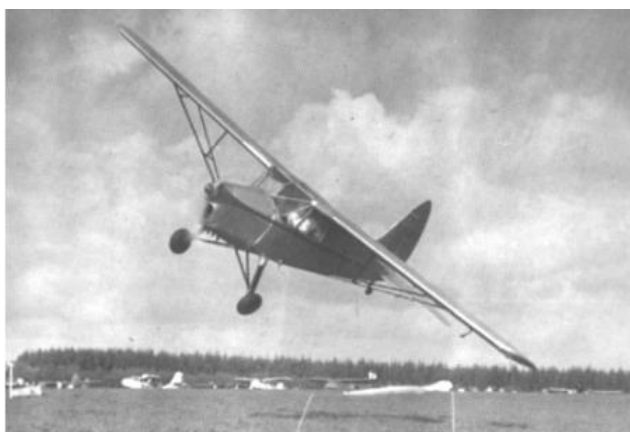
Sylvest Jensen havde også luftcirkus. Dette var den foretrukne flytype til dette.