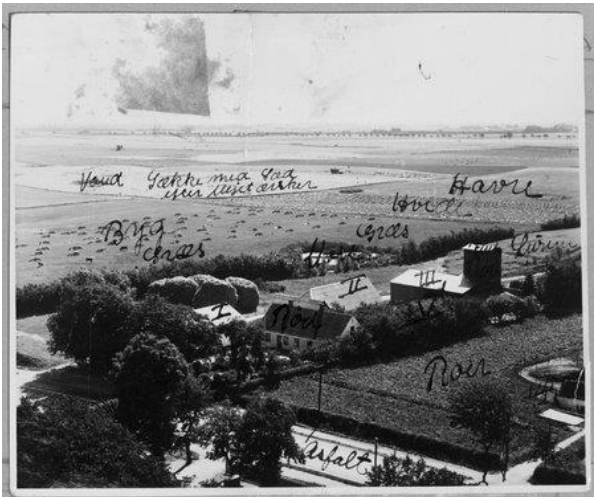
Billedet har notater til maleren om hvilke farve de forskellige afsnit af billedet skal have. Negativ H03815_p_031

"Flyvergården". Dette er sikkert en af grundene til, at der er så mange billeder fra "vores by". Billedet fra Skovbækgården er fra en optagelse i 1936-37.