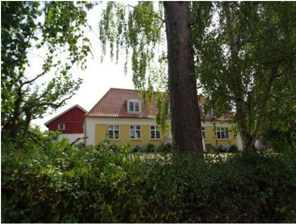
Stuehuset fra 1915, fotograferet 2018.