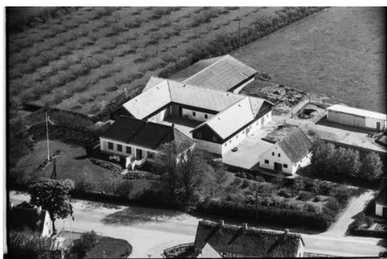
Lynghøjgård set fra nord, ca. 1949.

I Svogerslev er der snart ikke flere af de oprindelige gårde tilbage. Udstykningerne op gennem 60'erne og 70'erne har betydet at den dyrkede jord forsvandt, og gårdene blev derfor også nedrevet for at give plads til et parcelhus eller to!