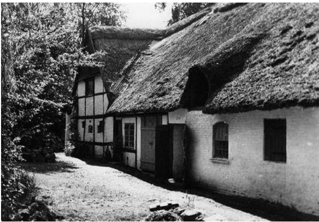
Et af Bondrup Hansens billeder af den gamle mølle kort før nedrivningen.

Nationalmuseet fik tilbudt mølleriet med henblik på opstilling på Frilandsmuseet. Der var arkitekter ude og bese værket, og der blev foretaget opmålinger og fotograferinger. Desværre takkede de nej. Og mølleværket blev fjernet.