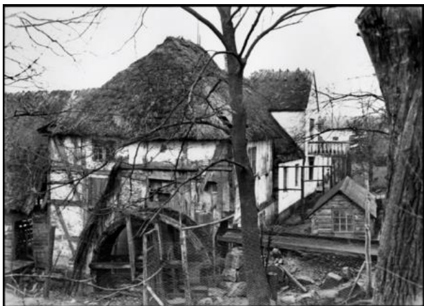
Mølleriet før nedrivningen