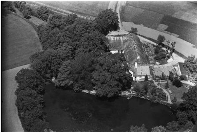
Møllegården i 1936-37. Mølledammen ses øst for møllen. Træerne er den spæde start på Mølleskoven.