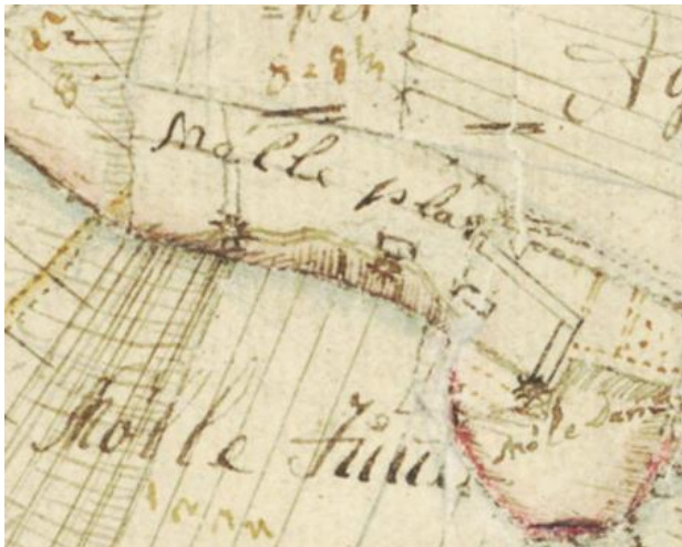
Udsnit af kort fra 1785.