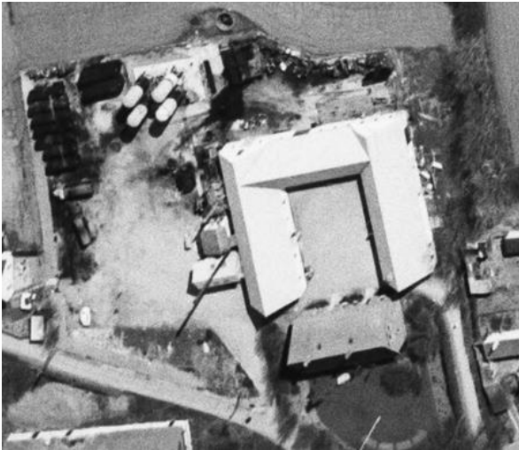
Luftfoto, maj 1966. Raffinaderiet Petrolia.