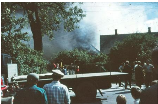
Petrolias brand, august 1965.