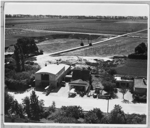
Det lille maskinværksted. 1953.

-fra maskinværksted til Maskinfabrikken .