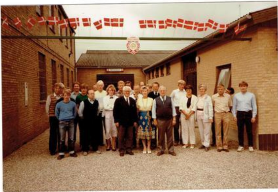
Medarbejderne ved maskinfabrikkens 40-års jubilæum i 1985.