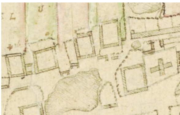
Svanemosegaard er gården under det store U. Bygaden 16 er måske det hus der ligger sydøst for denne.