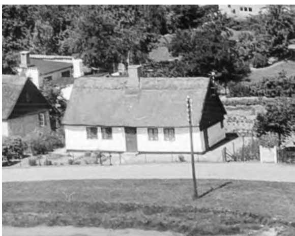
1957. Dør og vindue i østgavlen.

I denne uge fik vi en henvendelse fra ejeren af Bygaden 16. Hun oplyste at hun var ved at renoverer huset, og i den forbindelse havde fjernet indervæggene så bindingsværk og mursten stod fremme. Vi fik tilbuddet om at fotografere bygningen inden den blev renoveret færdig. Dette tog foreningen imod. Blandt andet fordi, bygningen, ifølge Bygnings- og boligregistret, Bbr, er en af de ældste bevarede huse i Svogerslev.