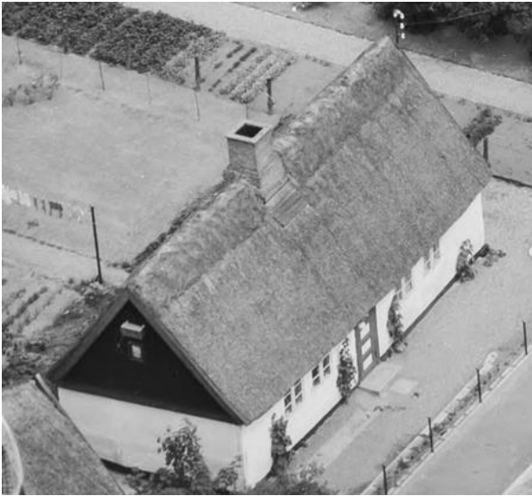
Huset som det så ud i 1957.