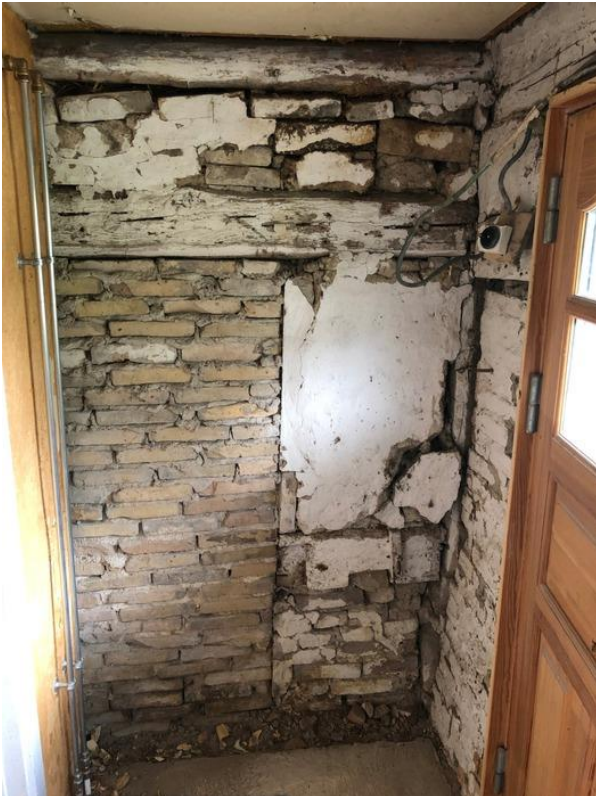
Den blændede dør i østgavlen anno 2019.