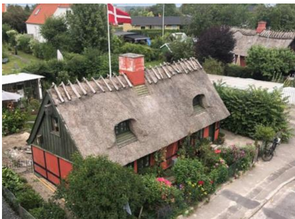
Bygaden 16 som det fremstår i dag.