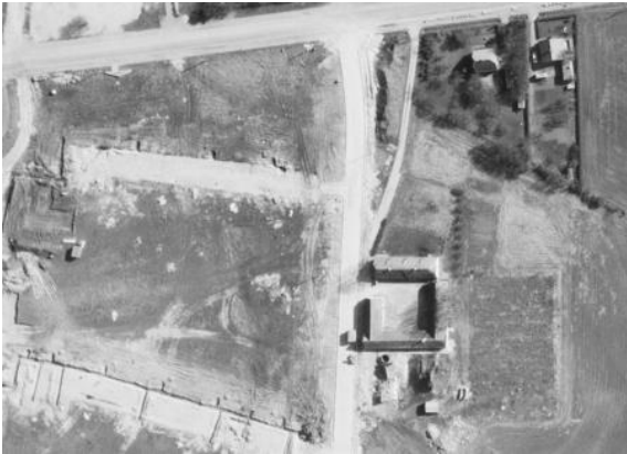
Billedet taget 3. maj 1970.