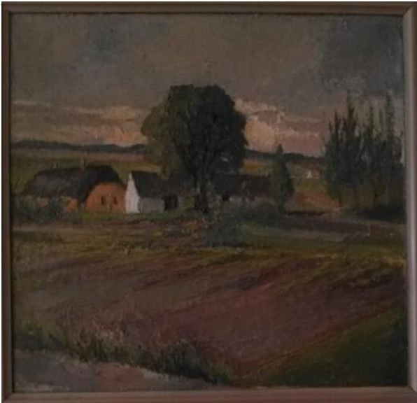
Kildegården. Malet af Kate Schertiger. Billedet er i privat eje.