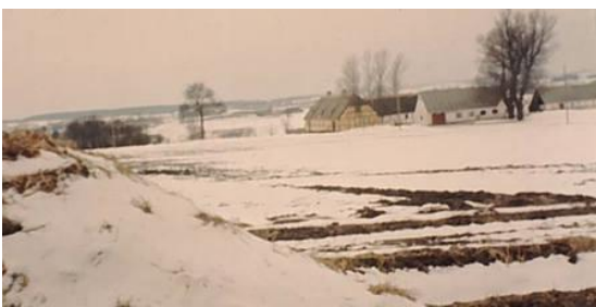
Kildegården ca. 1967.