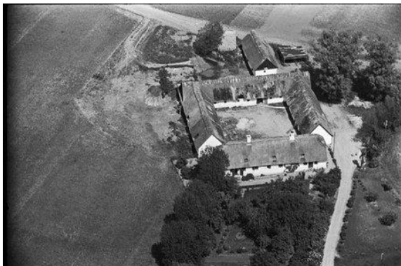
Kildegården ca. 1936.

Kildegården/Thorskildegården/Tyrestation en