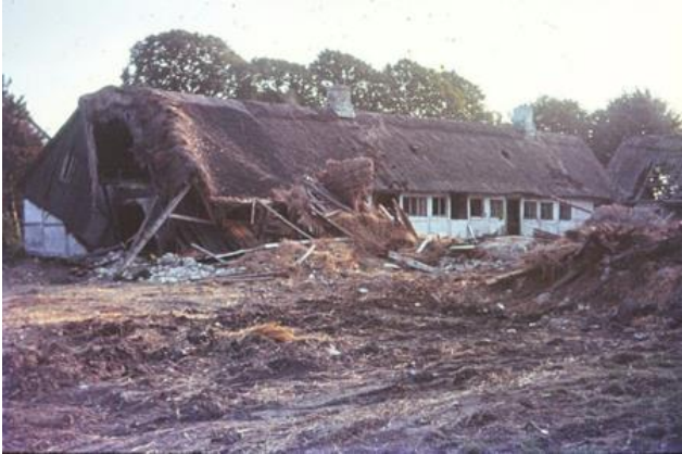
Gården nedrives, 1966.