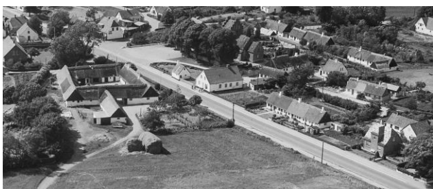
Gården set fra øst, 1956..