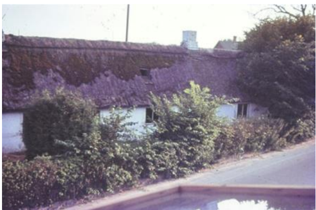
Gården i midten af 60erne.