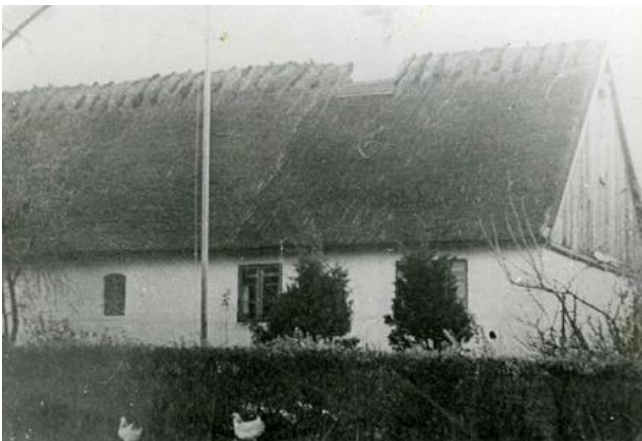
"Skvatbrinken", Lindenbergvej 85.

Navnet er ikke at finde i markbogen fra 1681, men optræder første gang på Stockfleths kort fra 1779. Navnet er muligvis opstået i forbindelse med den nye vejføring.