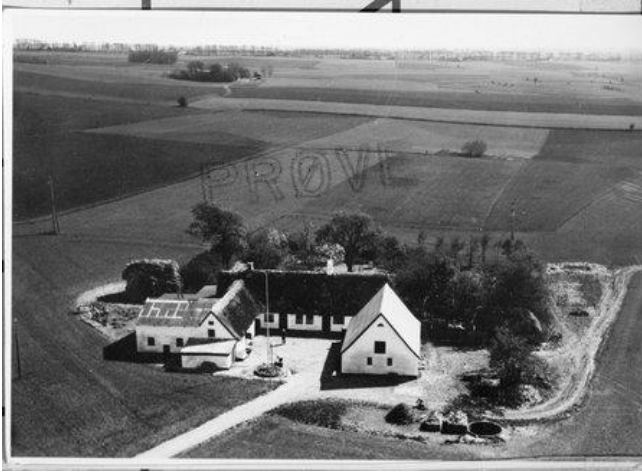
Skolen, nuværende Ågård, ca. 1951.

Søde rollinger der var, alle sang af glæde, for på mark ved sø og å, frit de ku´ betræde . Men da de avisen så, Skvattebrinken der sku´ stå, på skiltene herude, var de ved at tude!