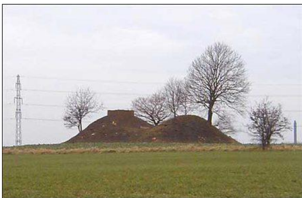
Vandtårn placeret i den gamle gravhøj ved Olufshøj.