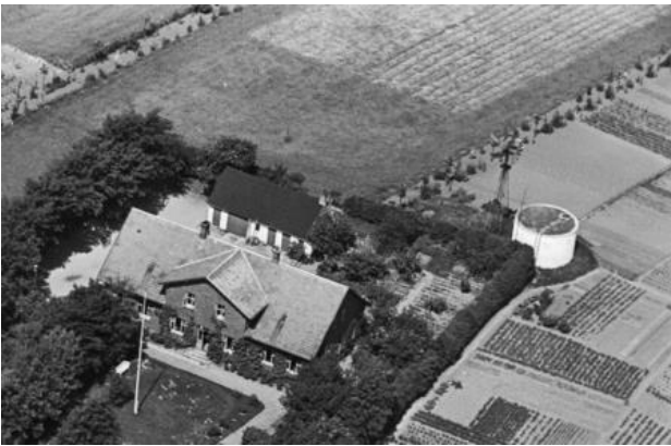
Vandtårnet ved Skolevej.

Senere bliver Svogerslev vandværk nedlagt, og byen får vand fra Roskilde vandforsyning.