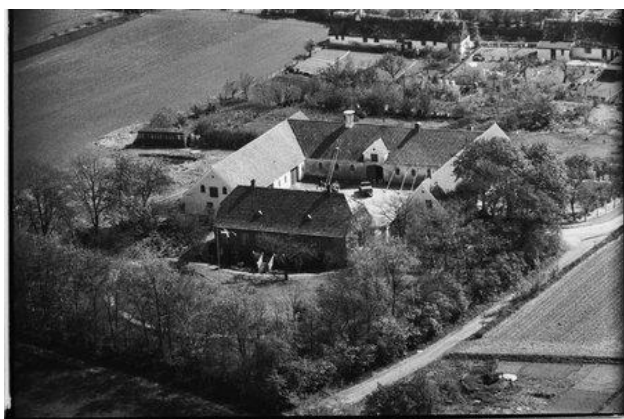
Kilden ved Nordgården.

I september 1905 anlægges der et vandværk ved Ledreborg Allé til brug for de tre gårde, Svanemosegård, Vejgård og Olufshøj. Anlægget bygges af vandbygningsmester Bjørn Henriksen. Tanken var, at vandbeholderen skulle sættes i gravhøjen Olufshøj. Der er endnu rester af beholderen. I Gyldenkærnes efterladte beretninger er en notits om at en mølle på Vejgårdens jorder pumper vand op til fælles vandværk for de tre gårde samt nogle huse i alléen.