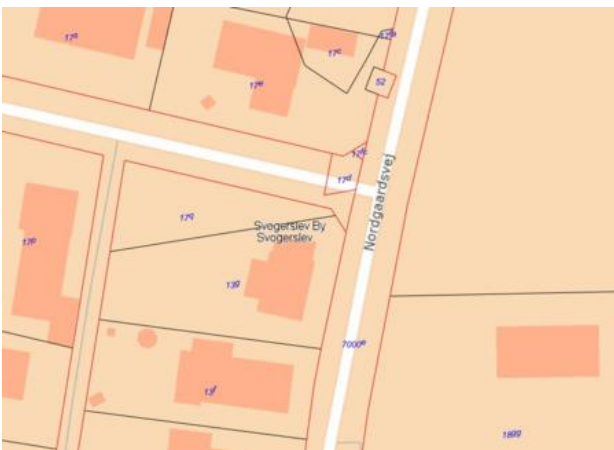
Kildens placering, matrikel nr. 17c.